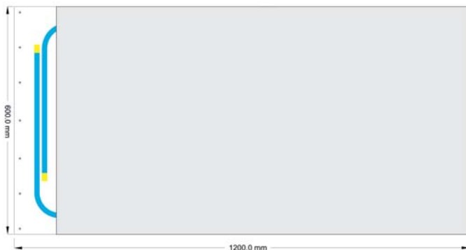
Maße Deckenheizungselement 1200 mm x 600 mm x 12,5 mm